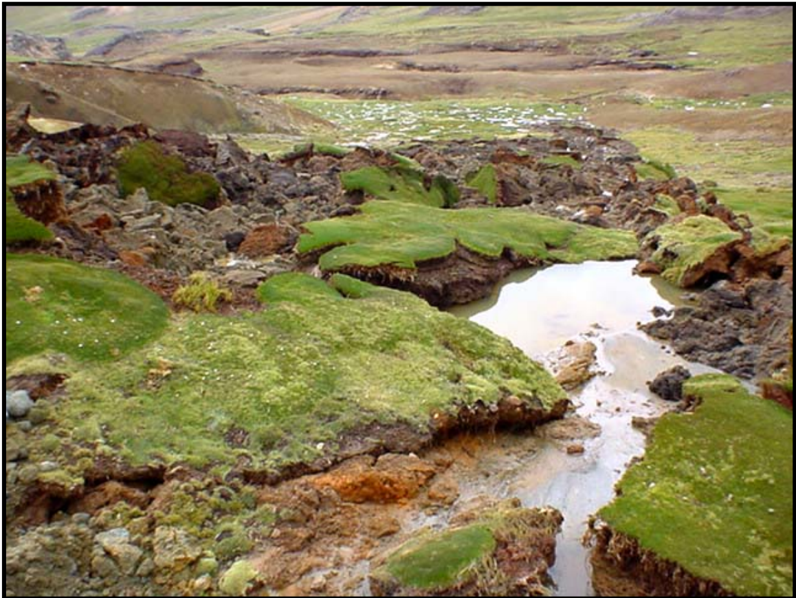
FOTO 01 CORTE Y DESLIZAMIENTO EN BOFEDAL