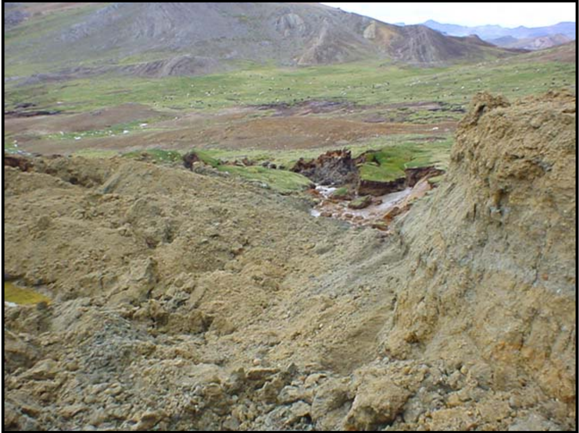
FOTO 02 SUELO DESLIZADO EN BOFEDAL